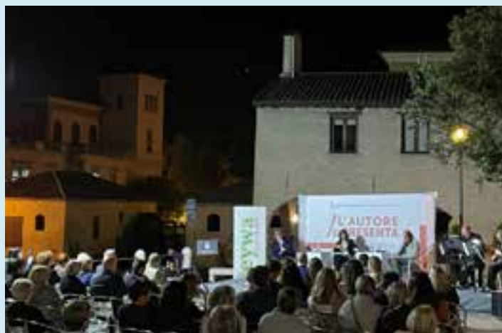
L'autore si presenta: serata iniziale in Piazzetta Pescheria