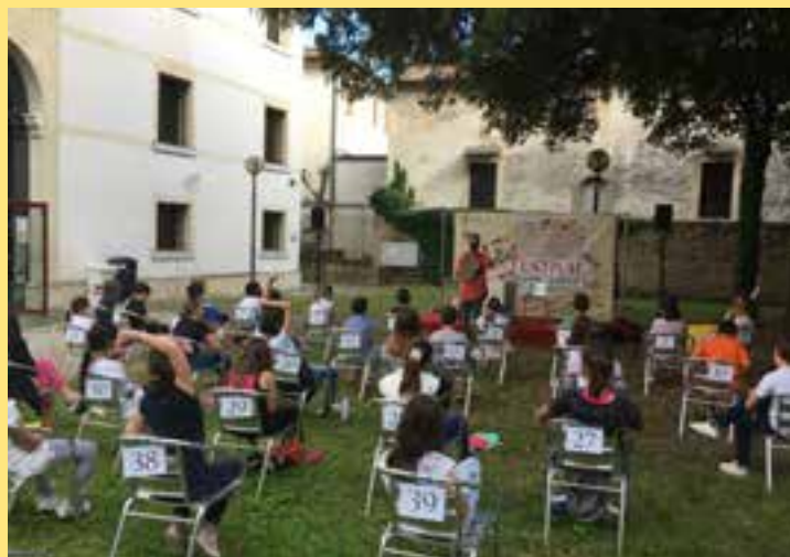
PortolImmaginario nel giardino della Biblioteca Civica

Complessivamente si sono alternati nei vari eventi 41 scrittori e 21 illustratori provenienti da tutta Italia e fra loro vincitori del Premio Andersen, Premio Bancarellino, Premio Letteratura ragazzi, Premio Strega ragazzi, nonché del premio internazionale Bologna Children's Book Fair.