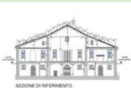
riqualificazione del palazzo municipale

Sia in relazione a quanto sopra evidenziato che con riferimento alle altre opere previste negli anni futuri il Comune ha partecipato a bandi di finanziamento ministeriali, i cui esiti non sono ancora noti.