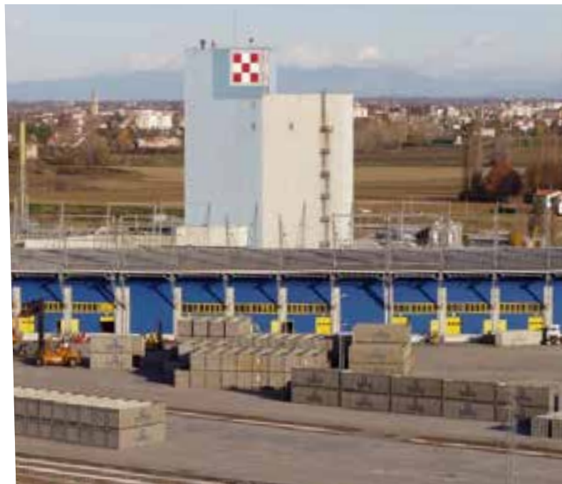
Il centro intermodale

Si configureranno anche una forte e positiva integrazione con le aziende locali, favorendone lo sviluppo e la crescita di ricchezza e occupazione, nonché una drastica riduzione delle emissioni di gas a effetto serra.