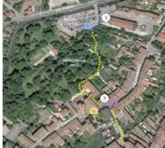
Progetto di pre-fattibilità: percorso di collegamento dalla Stazione ferroviaria al centro storico