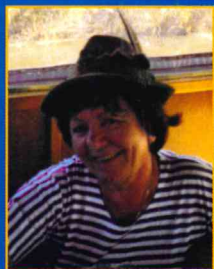
Virginia delle marmellate

OMOLOGAZIONE: Omologata con nota n. 21 del 1/1/2018 dal C.P. di Venezia e valida per tutti i concorsi Internazionali I.V.V. e Nazionali Piede Alato e Piede Alato Junior della rivista SPORTINSIEME organo Ufficiale della Federazione Italiana Amatori Sport per Tutti. Concorso Internazionale GAMBIA D'ARGENTO.